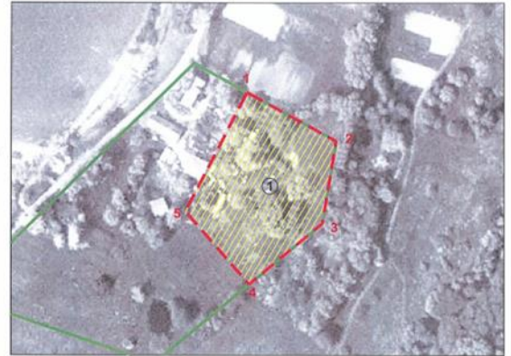
M 1 : 2 000 (viename cm - 20 m)