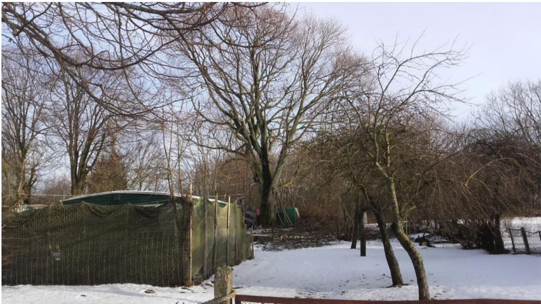
Ventės bažnyčios vieta (31755) / vaizdas iš ŠV pusės