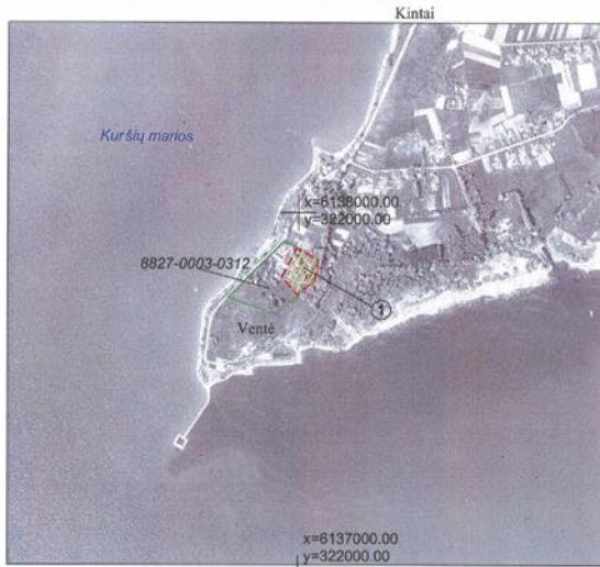
M 1 : 10 000 (viename cm - 100 m)

Ventės k., Kintų sen., Šilutės r. sav., Klaipėdos aps.