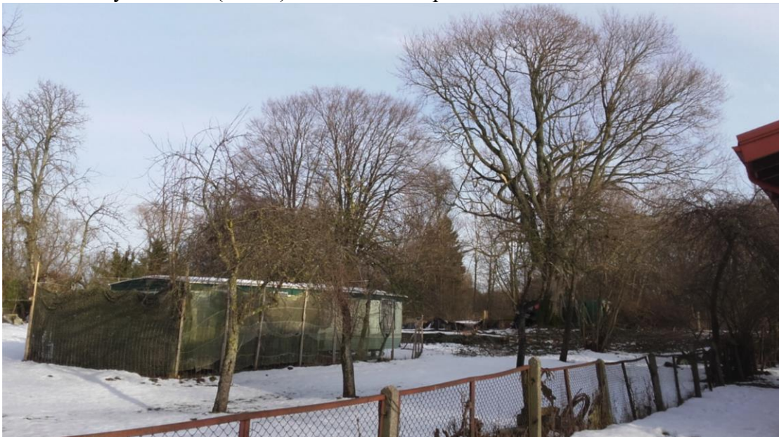
Ventės bažnyčios vieta (31755) / vaizdas iš PV pusės