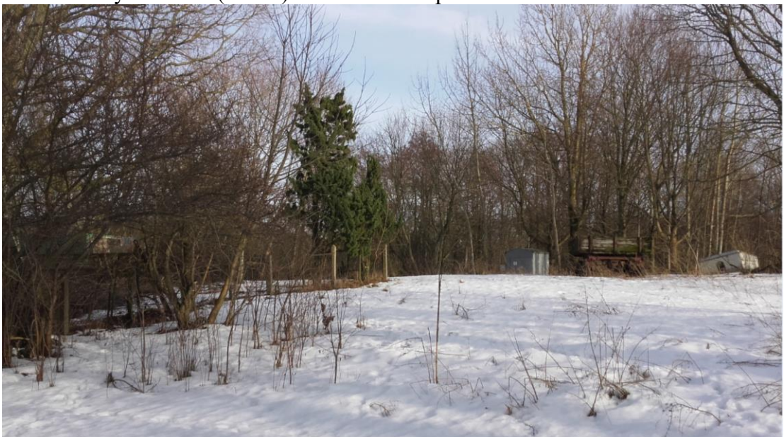
Ventės bažnyčios vieta (31755) / vaizdas iš P pusės