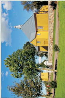
Šv. Vincento Ferero bažnyčia