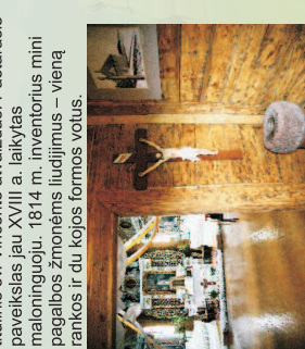
Vidiniai altoriai bažnyčioje

Iki šio išliko trys viršutinio altorio tarpinio šv. Antano Paduviečio, šv. Juodo Tado ir šv. Juozapo paveikslai, sukurti apie 1760-1763 m., to paties dydžio vienodos baroko ornamentinės formos, taip pat dabartinis titulinis šv. Vincento avizadas. Pastarasis maloninguoju, 1814 m. inventoriūsi mini pagalbos žmoniems liudijimus – vieną raktikos ir du kojos formos votus.