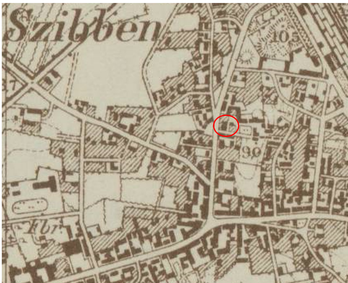
1944 m. vokiečių karinio topografinio žemėlapio Heydekrug 0694, fragmentas

Pastatas M. Jankaus g. 12 neoklasicizmo stiliaus mūrinis, 2 a. su pusrūsiomis ir mansardomis. Puošnus pagrindinis fasadas dekoruotas rustų imitacija, horizontaliomis traukomis, aukštus skiria dekoratyvinis frizas. Langai dekoruoti apvadais, II a. langai papuošti trikampaiais sandrikais. Fasadas simetriškos kompozicijos, centre nedidelis rizalitas ir neoklasicistinių formų frontonas.