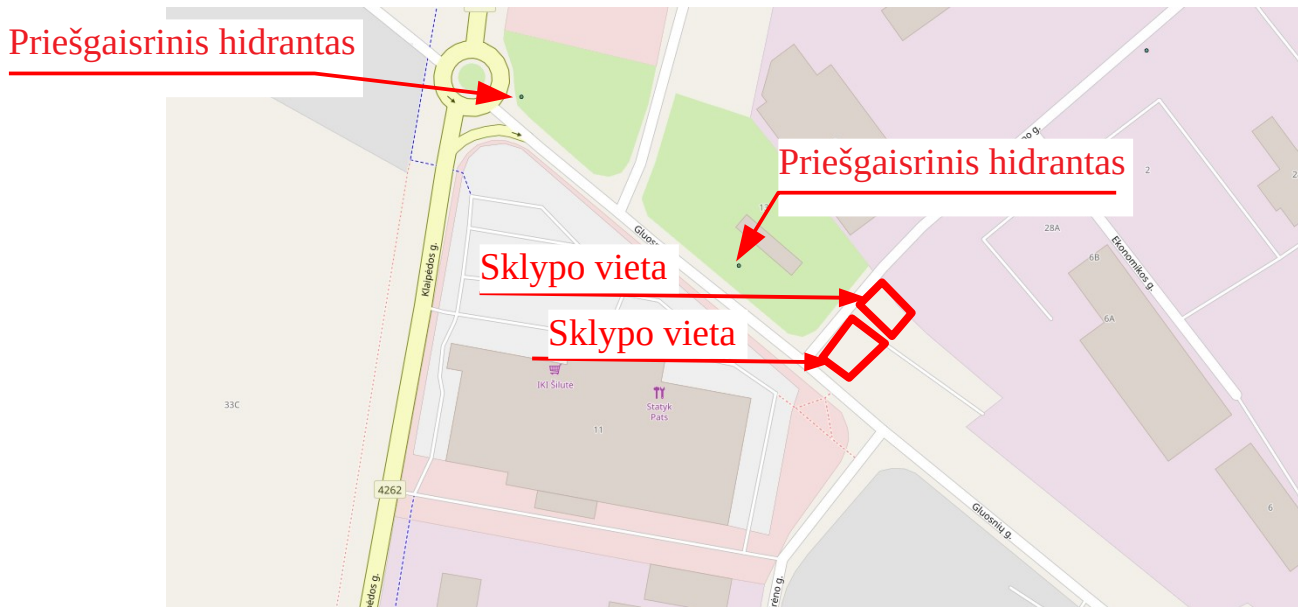
Pav. 2. Planuojamas teritorijos gesinimase

Reikiamas vandens kiekis gaisro gesinimui nemažiau kaip 108 m 3 . Pastatų gesinimas numatomas iš esamų miesto priešgaisrinių hidrantų, atstumas nuo planuojamų sklypų iki vandens telkinio mažesnis kaip 200m, privažiavimas prie hidrantų esamais privažiavimais.