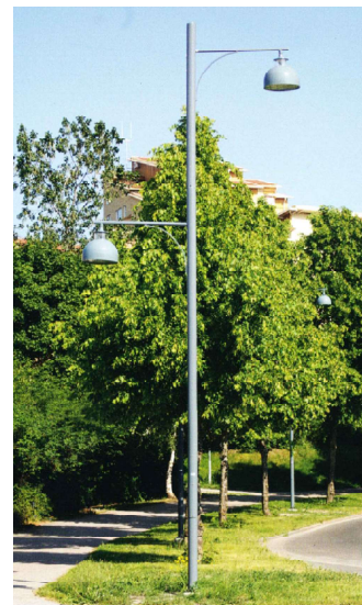
Projekte numatomos įrengti šiukšladiėzės

Projekte numatomos įrengti apšvietimo atramos ir šviestuvai (Sprendiniai elektrotechninėje (gatvių apšvietimo) dalyje)